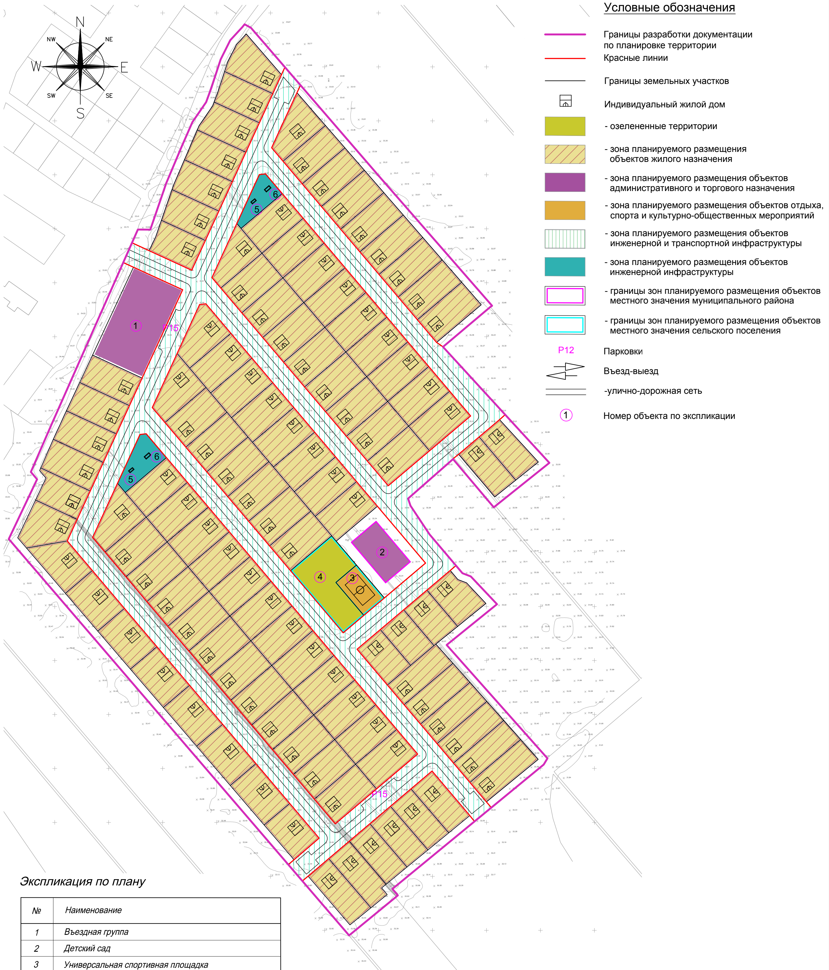
Экспликация по плану

Чертеж границ зон планируемого размещения объектов капитального строительства. М 1:2000